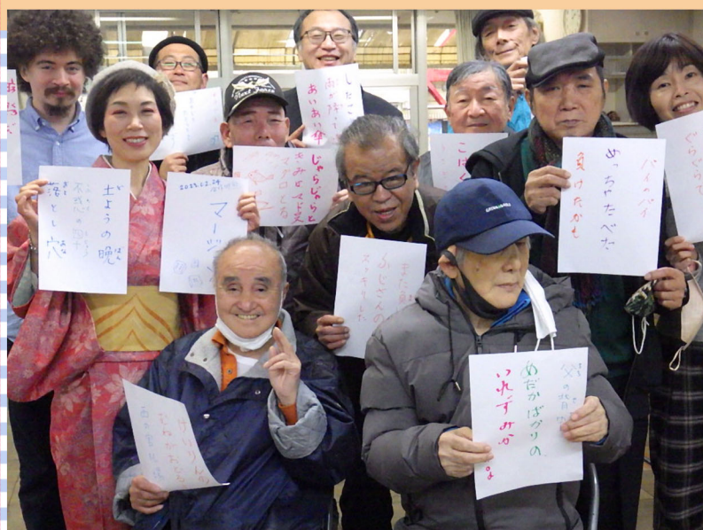
できた句はひと花に展示しています！

私のよもやま話 私は、この年になっても、父親を許して居ない事が、有ります。父親が亡くなって、15年になります。子供の頃、食事の時に、お前に食わす飯は無い。今日から飯食うな！ 突然、怒りだしました。母親が私にお前、何か、したんか！ 一緒に謝ってやるから、父さんに、謝れ！！ 意味が解らない私は、飯なんかいらんわい！ 箸を投げて、悔しいので隣の、叔母の家に行くと、直ぐに、母親が、お前が山羊の乳を飲んだと怒ってる。下の妹が生まれて、母親の母乳が少ないので、山羊の乳を与えていたのは、知っていたけど、私は、牛乳も、ミルクも嫌いでした。当然、飲んだ記憶も無い！ すると、叔母が、わしが、父親を怒ってやる。こっち来て、飯を食え！ わしは、犯人を知っとる！ この間、1年坊主の3人組が、寝てる山羊のお腹に、頭、突っ込んで、乳を飲んどった。！ 怒ってやったのに、又、飲んどったな！ 近所の皆がお前が、一番、貧乏くじ引いたな！ って笑って居ましたが、父親は、一度も、謝った事は無い、外ずらが良く、近所の人には、ニコニコして家では、威張ってる内弁慶の、親父ですが、この頃、許してやっても、いいかな一つて思います。私も西成に来て、十年になります。この頃、ふと、昔の事が懐かしい思い出として、浮かぶ事が有ります。 桐井でした。