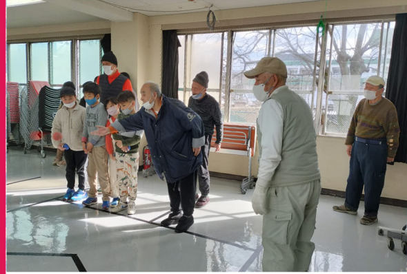
▲市民館にてボッチャ大会をしました。中盤までひと花が圧倒していましたが、最後はこどもの家チームが優勝!

一人で生きていくのはさみしいと思。いろいろなひと花センターに登録していろいろな行事に参加する事によってさみしいから開放されると思。います。休養者より