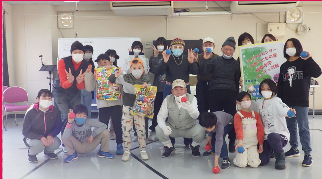
今池こどもの家&成南中学校ボランティア部のみなさんとボッチャ大会をしました!!

私が中学生の頃で、義侠神の三宮の一角で母親が小売りの喫茶者をしていました。その場所は日本人も立ち入る所でした。なせならそこは数100軒近く並ぶアメリカ兵相手の店がありました。そこで初めて女性に世間からはパンパンのチはれいでした。彼女通は体臭の臭い家におくりにした。何も好きの心でかいていたのでよくやめにやるとなりました。私はそんな彼女とはきつてはありませんでした。時々席に来てるやみ帯や、いびき声と母親に打ちあけていた。そんな時に私は毎年とつめてえやから出来るかと思。彼女は何人かに年賀状を送りました。その結果、私に会いに来てくれてびっくり人気がいい中では涙を流した人もいました。彼女達の心が少しもよこしたと思。つめてえや。それから彼女達が私をたててデパートでほし物を買ってくれたり。おいしい物を食べたりしていいことになった。昔は多ククワイヤとロヤの競争が行われ、それがなくなるまで続いた。世界一競争で心をこめて作ったのが日本だと思。とくじい