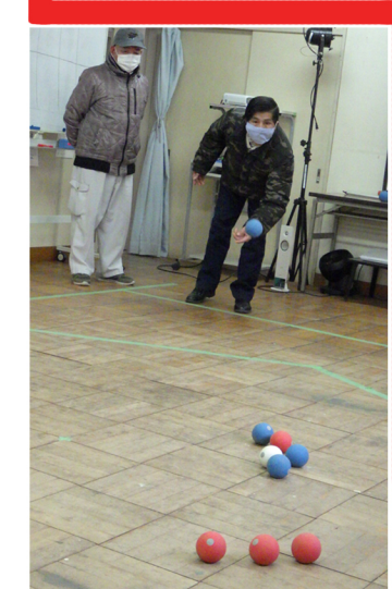
上：衣類の仕分け 下：今工清掃

ひと花センターではボランティア参加希望者大歓迎！ 気になる方はスタッフにお声がけください！