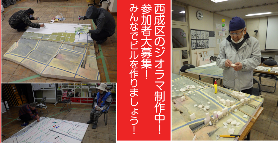
西成区のジオラマ制作中！ 参加者大募集！ みんなでビルを作りましょう！