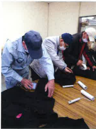
リース毛玉作り 始動