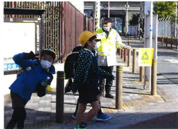
子ども見守り隊 引越して継続中