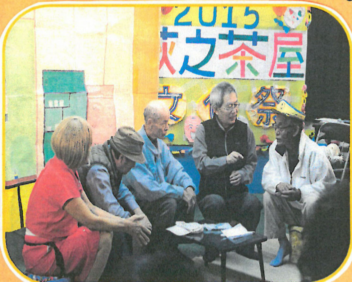
ひと花笑劇団「愛情航路」千秋楽ありがとうございました