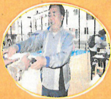
今年も「せんぱい」と「無農薬野菜」の出店！大盛況でした！

今年もひと花センターとして萩之茶屋文化祭に参加させていただきました。作品の展示、ひと花笑劇団「愛情航路」千秋楽公演、野菜とぜいざいの出店、ひと花音頭と二日間盛りだくさんでした。ご来場の皆さまありがとうございました。皆さまからのご声援はメンバーのさらなる「やる気」につながります。来年もどうぞよろしく願います。