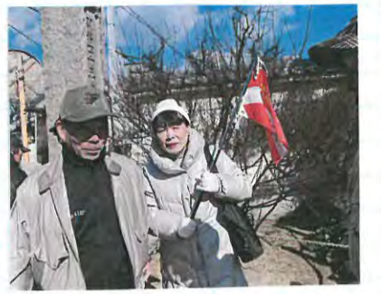
● 冬もすぎ 花咲き乱れ 春つらら (政)