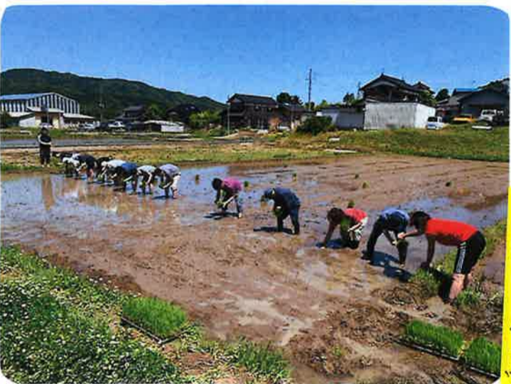
京丹後にて 田植え体験 おいしい 新米が 楽しみ!!