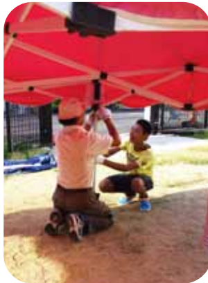
こども祭りテントたて