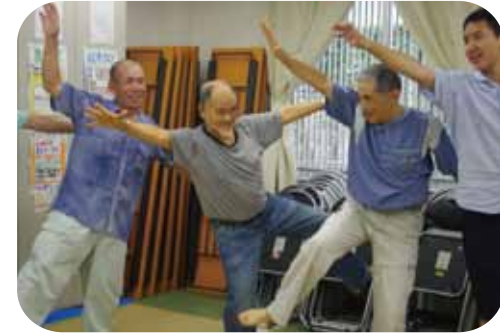
ダンス ころとからだをほぐす